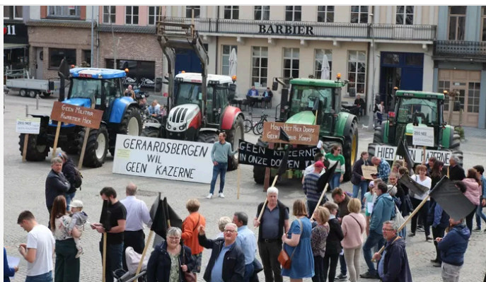
Geraardsbergen: Tegen de komst van een legerkazerne wordt al anderhalf jaar actie gevoerd..